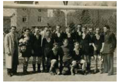
Herren Meister Saison 1952-53 Aufsteiger in die 1. Kreisklasse

Reichlich zehn Jahre später gab der Verein seine Eigenständigkeit auf und fusionierte mit dem SV Klinga/Ammelshain, dessen erste Herrenmannschaft in der jüngeren Vergangenheit große sportliche Erfolge