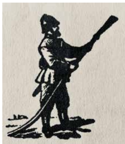
Vignette für die Einladungen der freiwilligen Feuerwehr in Naunhof