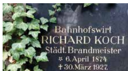
Ausschnitt aus Grabplatte des Erbbegräbnisses der Familie Koch auf dem alten Friedhof zu Naunhof

„Naunhof, den 18.04.1920. Die Feier ihres 12. Stiftungsfestes konnte am Mittwochabend die Freiwillige Feuerwehr im Sternsaale festlich begehen. Neben der Mitwirkung des Gesangsvereins „Harmonie“, welcher einige gutgewählte Liedervorträge darbot, verdient insbesondere das Konzert der Naunhofer Wehr-Kapelle (Dir. Fr. Blohm) hervorgehoben zu werden, das unter bewährter Leitung des Herrn Helm den Glanzpunkt des Abends darstellte. Man folgte den musikalischen Genüssen mit sichtlichem Interesse und spendete als Dank und Anerkennung stürmischen Beifall, der besonders zum Schlusse der Vortragsfolge nicht enden wollte und mancher der Festteilnehmer gern noch ein weiteres Musikstück zu hören wünschte, was aber infolge der frühen Polizeistunde nicht möglich schien.“