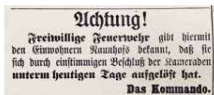
Anzeige für Auflösung 11. März 1908