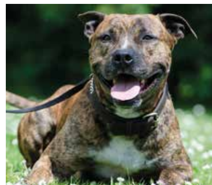
Der American Staffordshire Terrier gehört in Sachsen zu den sogenannten Listenhunden. Bei ihnen wird die Gefährlichkeit von Gesetz wegen vermutet.

Möchte sich ein Bürger einen Listenhund (dies sind in Sachsen folgende Rassen: American Staffordshire Terrier, Pitbull und Bullterrier bzw. eine Kreuzung dieser drei Hunderassen untereinander) anschaffen oder hat dieser bereits einen, so muss dies beim Landratsamt Landkreis Leipzig, Amt für Rechts-, Kommunal- und Ordnungsangelegenheiten, SG Allgemeine Ordnungsangelegenheiten angezeigt werden.