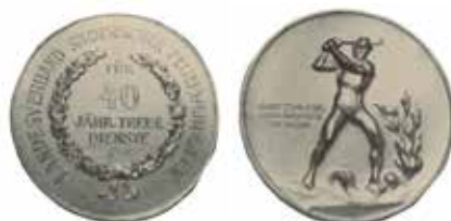
Vorder- und Rückseite der Medaille 40 Jahre Feuerwehr des Freistaates Sachsen