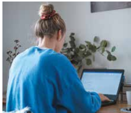
Allein und doch im Team – digitale Tools erleichtern den Austausch und die Kommunikation mit Kollegen.

Wenn persönliche Abstimmungen, Meetings und der Plausch an der Kaffeemaschine wegfallen, fehlt es am Austausch mit den Kollegen. Stattdessen lassen sich digitale Tools nutzen, um das Zusam-