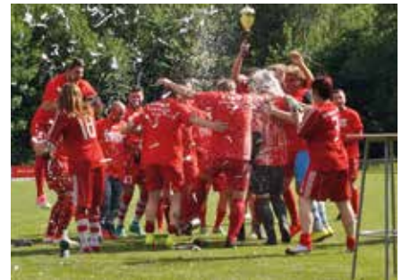
Aufstieg in Landesklasse 2017

(Aufstiege in Bezirksklasse und -liga) erzielt hatte. Im ersten gemeinsamen Jahr konnte die erste Herrenmannschaft in der Saison 2004/05 den Bezirksmeistertitel erringen und in die Landesliga Sachsen aufsteigen. Nach zwischenzeitlichem Abstieg etablierte sich das Team in der Landesliga, in der Saison 2010/11 entschied sich der Verein aber trotz des sportlich geschafften Klassenerhaltes aufgrund struktureller und organisatorischer Probleme zum Rückzug in die Bezirksliga. Nachdem auch diese in der Saison 2012/13 nicht gehalten werden konnte, ging die erste Naunhofer Mannschaft in der folgenden Saison 2013/14 erstmals in der Kreisoberliga auf Punktejagd. In der Saison 2016/17 holte sich das Team den Meistertitel in der Kreisoberliga und stieg in die Landesklasse auf, die sie nach dem Ende der Saison 2018-19 wieder verlassen musste, nachdem sie lange Zeit auf einem Tabellen-Mittelfeldplatz gestanden hatte.