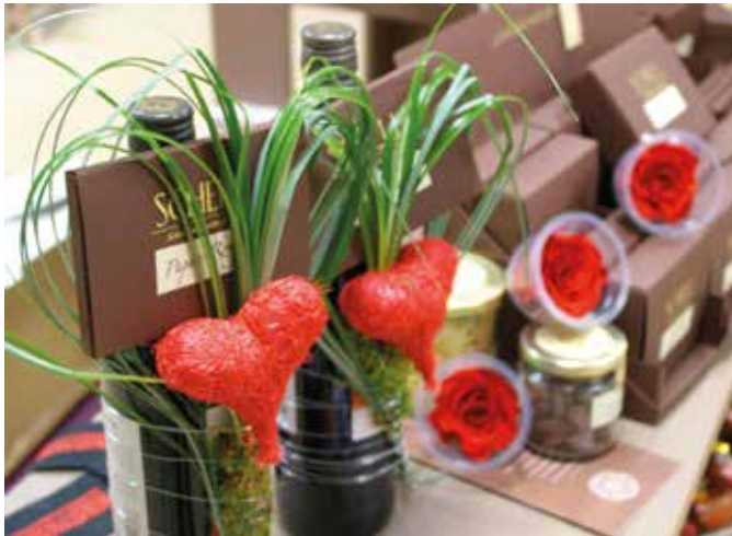
Mit Liebe conchiert, mit Liebe dekoriert, mit Liebe geschenkt ...