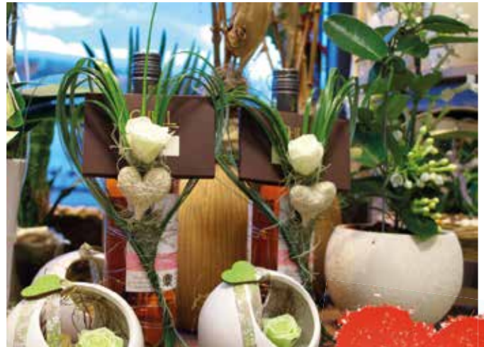
Perfektes Muttertagsgeschenk: Schokolade und Wein.